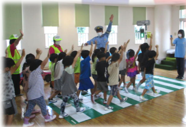
児童生徒に対する交通安全教育