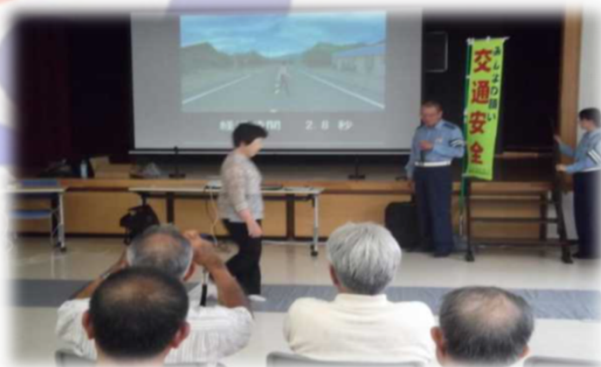
高齢者に対する交通安全教育

交通事故分析を踏まえた悪質・危険な交通違反に対する取締りの徹底と、歩行者に対する保護意識の向上のほか、自転車や新たな交通モビリティの正しい通行ルール の周知など、広報啓発活動を積極的に推進し、道路管理者等と連携した総合的な交通事故抑止対策を継続します。