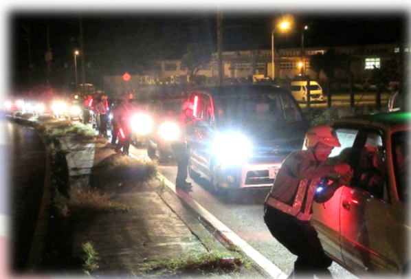
交通検問による飲酒運転取締り