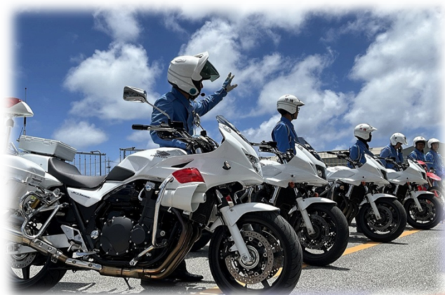
自バイ隊による交通取締り